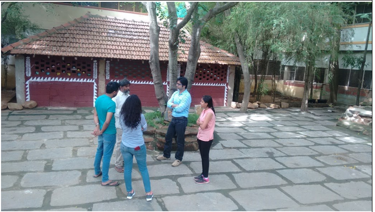
Development of Corporate Citizenship Program by MBA students of SP Jain Institute of Management, Mumbai; 07 th June to 20 th June