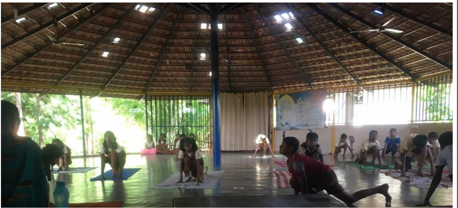
Yoga Session on Day 1