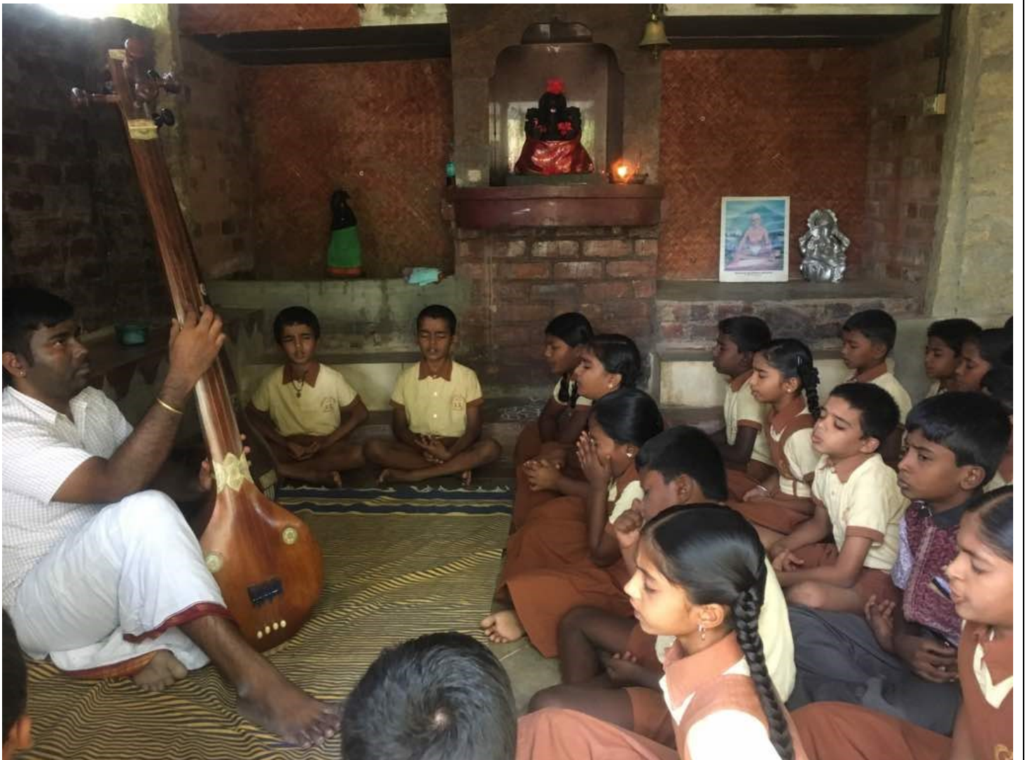
Music and Chanting Class by Anantraman