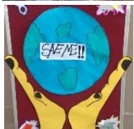
05 June : World Environmental Day : The day long celebrations included planting, Quiz Program, Painting and Group Discussions. Above : Quiz program in Progress