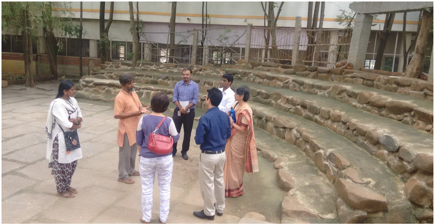
1st June : Visit of Team from Exxon Mobil India