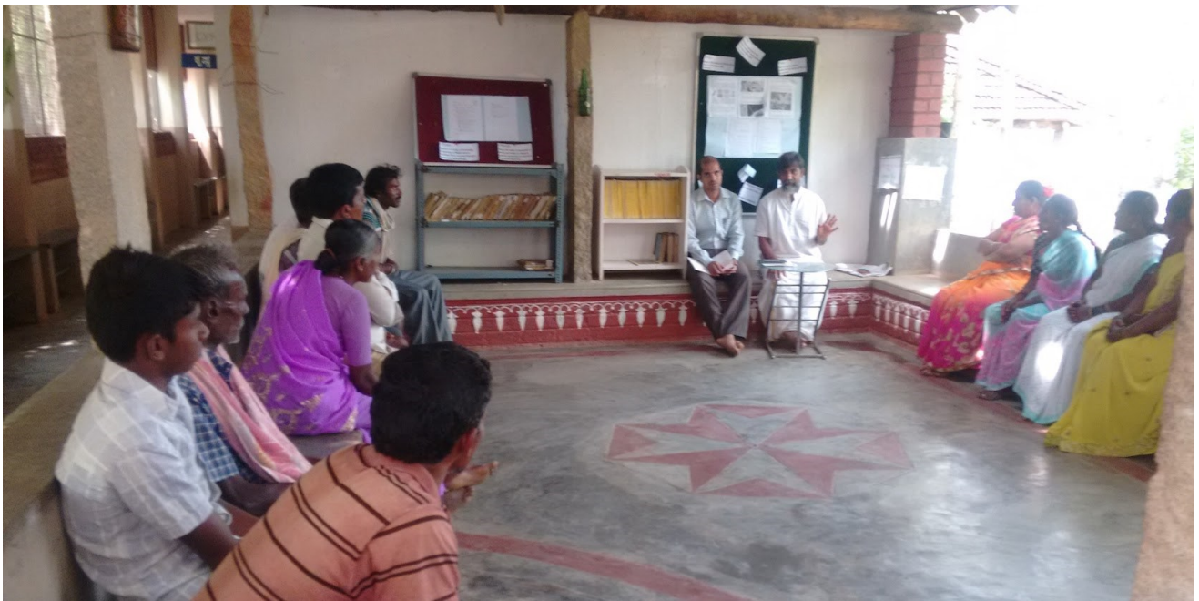
03rd June Meeting with Parents : Scholarship Recipients