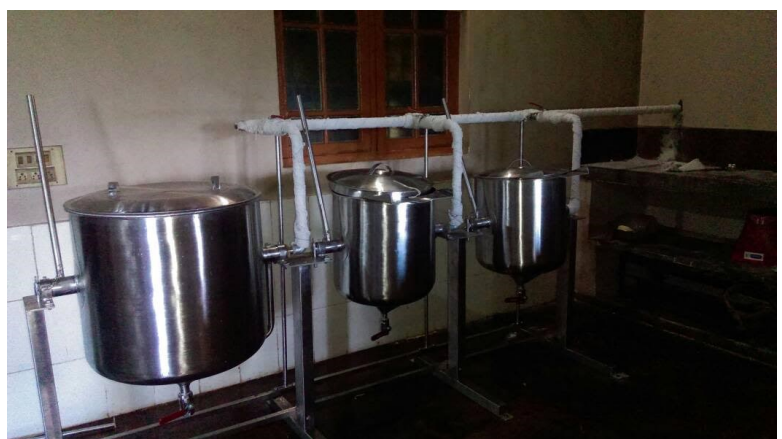
Kitchen Upgradation : Installation of Steam Cooking Equipment